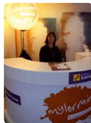
Borne d'information sur mylorraine.fr

Une borne d'information présentant l'activité de mylorraine.fr est accessible à l'Espace Tilleul.