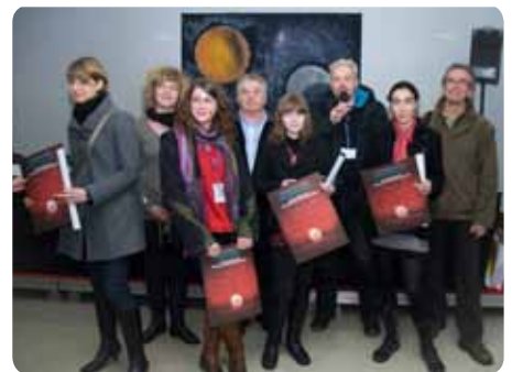
Les lauréates du concours de nouvelles fantastiques

Egalement présent, Henri Loevenbruck a rappelé que la rédaction de nouvelles était un véritable exercice, à la source même de l'écriture.