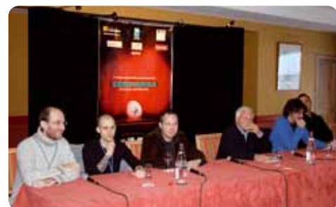
Les 1 ères Rencontres Internationales du Fantastique

Depuis de nombreuses années, le festival est un formidable lieu d'échange entre passionnés. C'est l'occasion d'assister à la projection de nombreux films, de débattre autour des thèmes du genre et de découvrir de nouveaux acteurs du paysage fantastique. S'adressant au grand public, le festival permet également la rencontre de nombreux professionnels venus de tous les continents. Quoi de plus naturel que de leur dédier un forum où ils pourraient débattre des points-clé du cinéma de l'étrange ? C'est sur ce principe qu'ont eu lieu hier les 1 ères Rencontres Internationales du Fantastique aux salons de l'Assiette du Coq à l'Ane du Grand Hôtel & Spa. Ouverte au public, cette table ronde a réuni réalisateurs, directeurs de festival, critiques et producteurs autour de deux thèmes : les enjeux du cinéma fantastique aujourd'hui et son évolution récente d'un point de vue économique.